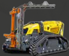
Potatrice a dischi