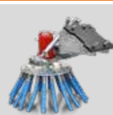
IRON BRUSH SPAZZOLA IN ACCIAIO