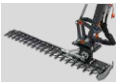
CUTTER BAR BARRA FALCIANTE