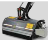
GARDEN 80 TESTATA TRINCIANTE CUTTING HEAD