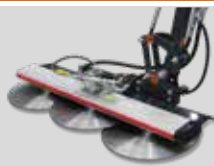
SAW BAR BARRA A DISCHI